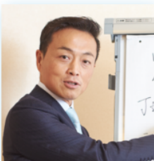
たすくグループ・代表

北海道函館盲学校、国立久里浜養護学校、国立特別支援教育総合研究所・主任研究員を経て、現職 ・早稲田大学 教育・総合科学術院 非常勤講師 ・公益財団法人日本知的障害者福祉協会 人材・育成委員 ・東京都立特別支援学校 外部専門員 (10校) ・東京都立特別支援学校 学校運営連絡協議会 評価委員 (3校)