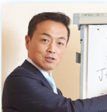
たすくグループ・代表

北海道函館盲学校、国立久里浜養護学校、国立特別支援教育総合研究所・主任研究員を経て、現職 ・早稲田大学 教育・総合科学術院 非常勤講師 ・公益財団法人日本知的障害者福祉協会 人材・育成委員 ・東京都立特別支援学校 外部専門員 (10校) ・東京都立特別支援学校 学校運営連絡協議会 評価委員 (3校)